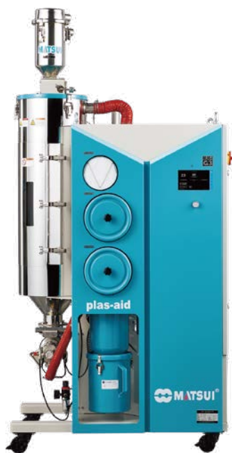
[ MJ6-i-G3-30 ]

マツイが開発したセルフコントロール機能を持つ智能化された乾燥機です。成形機側の樹脂の使用量に応じて、乾燥風量や再生風量を最適コントロール。樹脂の乾燥度は維持しながら究極の省エネを実現します。