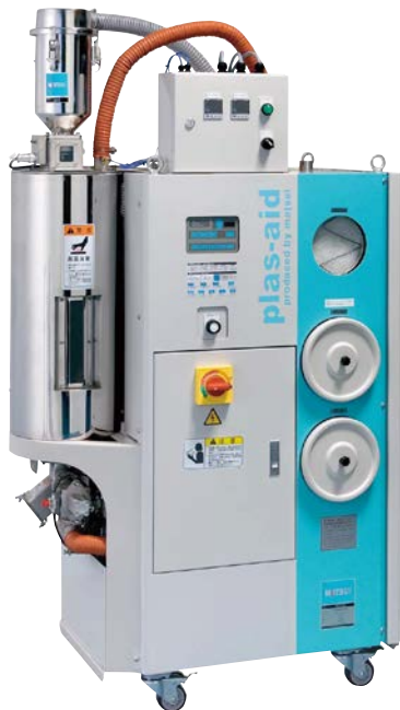
[ MJ3-SE ]