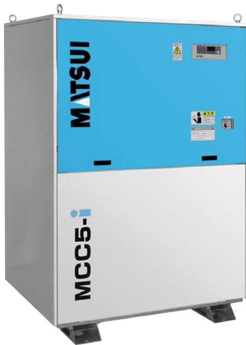
[ MCC5-i ]

圧縮機の出力をインバータで制御する金型冷却機（チラー）です。 熱負荷状況にあわせて装置を自動制御することで、従来機と比較して大幅な省 エネルギー化を実現することができます。