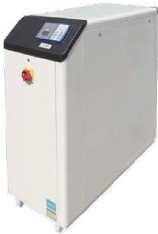
[ RCD180 / 24 ]

フリークーリングとは、冬などの外気温度が低い時期や、要求される冷却水の温度がそれほど低くないときには、チラーをストップし、冷却塔（クーリングタワー）からの水を直接冷却水として利用するシステムです。 チラーの稼働率を抑え、ムダなエネルギーを削減します。