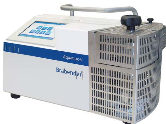
[ AQUATRAC-V ]

カールフィッシャー方式の水分測定方法とは異なり、サンプリング場所へ持ち運べ、正確に計測が可能、誰が測定しても同じ再現性を持っています。 定期的な計測で、成形不良の未然防止と、エネルギー節約を同時に実現！