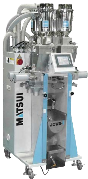
[ JCW2 - i - 05 ]

マツイが開発したセルフコントロール機能を持つ知能化された配合装置です。樹脂の使用量を自ら判断し、必要最小限の配合バッチ量に自動的に最適化、混ぜ残りを最小限におさえます。