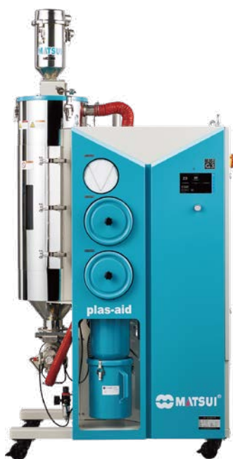
[ MJ6-i-G3-30 ]

独自に開発したセルフコントロール（iplas制御）機能を持つ、知能化された乾燥機です。成形機側の樹脂使用量に応じて、乾燥風量や再生風量をコントロールします。最適な状態の樹脂を供給することで、可塑化が安定し、黄変を防止します。