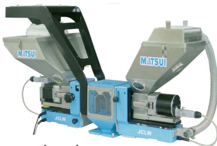
[ JCLW ]

小型・軽量、成形機上に設置が可能のため、理想的な配合が可能です。配合後の材料を輸送しないため分離がありません。また、専用設計のシリンダとドージングシステムで、色ムラのない、安定した着色が可能です。