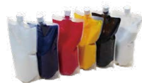
リキッドカラー パウチ