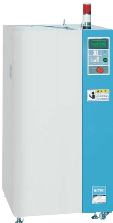
[ DPD3.1 ]

真空による乾燥では、ペレットの加熱のために熱風を当てる必要がなく、水分を外部に出すための最小限のページエアーを使うのみです。このことによりコンタミのリスクを低減することができます。また真空下で乾燥させるため、材料によっては、酸化・黄変を防止し、黒点異物を減少させる効果もあります。