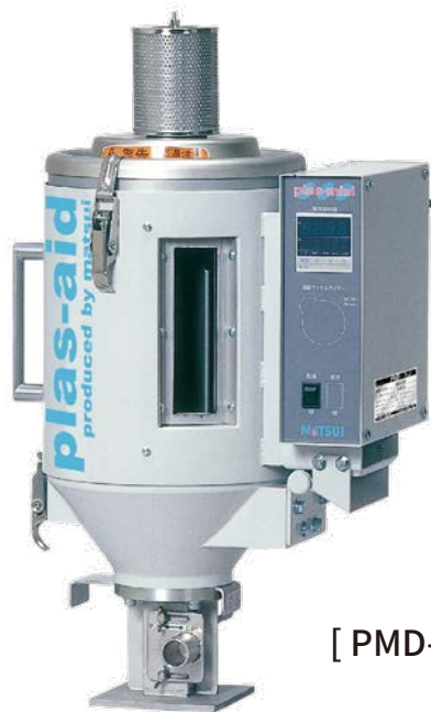
[ PMD-1.5 ]

伝熱による乾燥では、ペレットの加熱のために熱風を当てる必要がなく、水分を外部に出すための最小限のパーリエアーを使うのみです。このことによりコンタミのリスクを低減することができます。又、窒素ガスでパーリエアすることにより材料によっては、酸化・黄変を防止し、黒点異物を減少させる効果もあります。