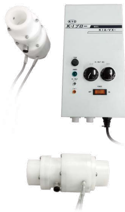
[ KI-2000-ATC-38 ]