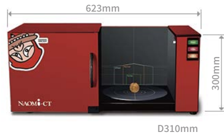
[ NAOMi-CT100 ]