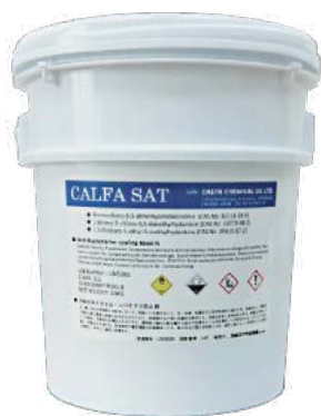
樹脂ペール缶入り