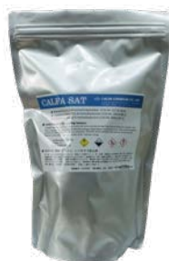
アルミバッグ入り