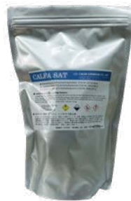
アルミバッグ入り