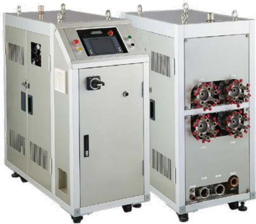
RHCM2-100G (1 回路)