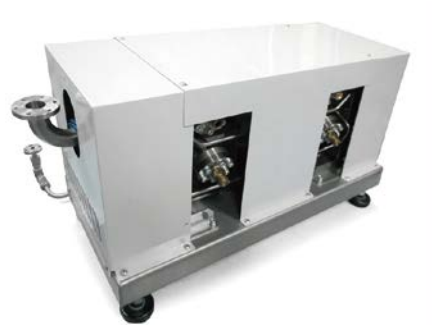
[油媒体式 ヒート＆クール 成形用バルブコントロールユニット]